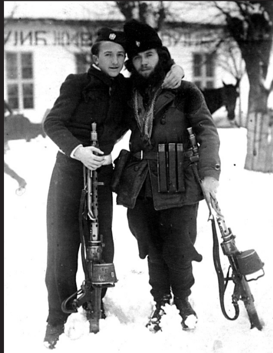
Suđenje Draže Mihailoviću u Beogradu, 1946. godine (gore); Dobroslav Jevđević i talijanski časnik agitiraju. Fotografija iz 1942. (gore lijevo); Milorad Popović, četnički zapovjednik nevesinjskog korpusa, u društvu s talijanskim oficijom u Prozoru, listopad 1942. (gore, desno); Četnici (lijevo); Jevđevićevi četnici pale selo, 1942. (velika fotografija)